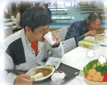
カレーや肉じゃが、 温野菜に舌鼓♪