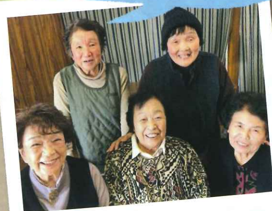
元気の源は毎週月曜日にある仲良しメンバーの集まり★