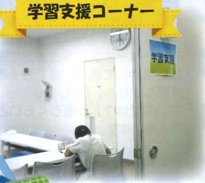
学習支援コーナー