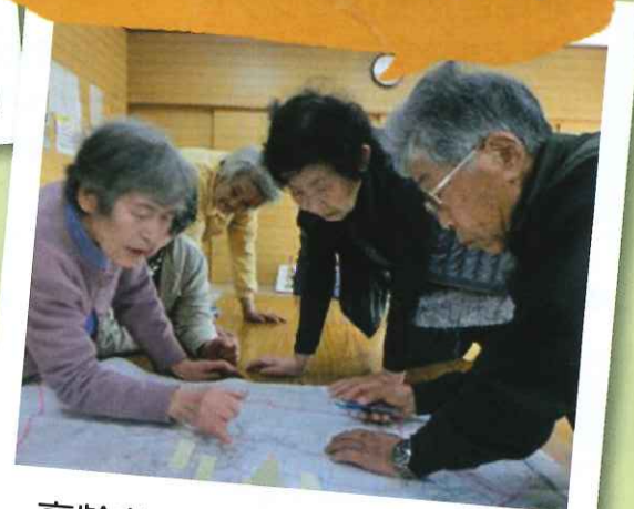
高齢者の居場所として始まった久礼田地区老人クラブによるサロン活動☆★