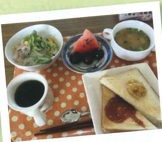
第2月曜日に開催されている滝本のモーニングサロン★