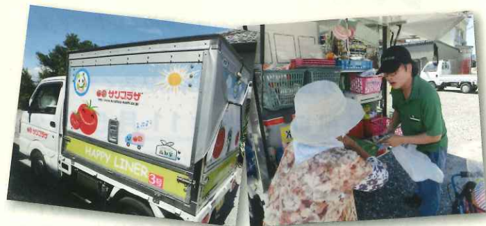
とても気さくで、仕事に誇りを持って楽しまれている、素敵な方でした！

また「地域見守り隊」という役割も兼ね備えており、お客さんで認知症ではないかと思われる方を包括支援センターにつなげたことで元気になられ、その時は安心しました。