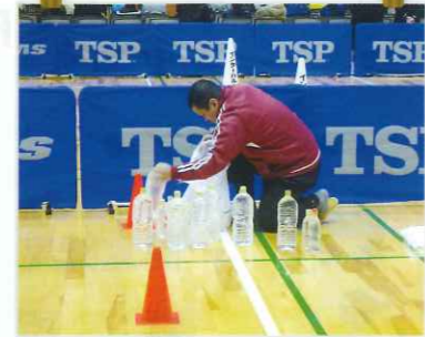
ボランティアについて楽しく学ぼう!