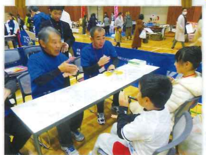
手話も教えてもらいました*