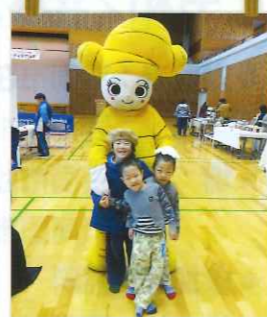
しょうがちゃんもニッコリ

今回のなんこくボランティアDAYでは、災害やスポーツ等に関するボランティア体験や動物の愛護団体によるボランティア紹介など、ボランティアを身近に感じ、新たに知ってもらえるきっかけになりました。また、ステージでは学生やボランティア団体などの皆さまによって大変盛り上がり、マルシェでは南国市内外から福祉施設等をはじめ、様々なお店の方に出店していただきました。このイベントを通して、ボランティアに関心を持ってくださる方が増えたら嬉しいです!