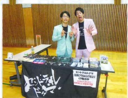
セントラルドグマのステージも◎