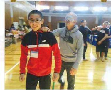
色々な体験コーナーもありました☆