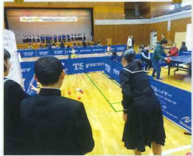
1番人気のポッチャは大盛り上がり!