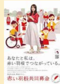
令和3年度赤い羽根共同募金ポスター(全国版)

本年も10月1日から全国一斉に赤い羽根共同募金の運動が始まっています。子どもからお年寄りまで一人ひとりが安心感と生きがいを持って暮らせる地域づくりの取り組みは、社会情勢、地域福祉課題が様々ある中、今後ますます重要になります。本年も新型コロナウイルス感染症の影響を受け、対応が長期化し、経済的な困難から衣食住が十分に確保できない人、居場所を失い孤立を深めている人、あるいはしゃべる相手もなく生活のハリをなくしている人…さまざまな人々がさまざまなかたちで困っています。共同募金への寄附金は、その取り組みへの貴重な民間財源になります。共同募金運動は、各地区、職場、学校などで行われています。皆様のご支援、ご協力をどうぞよろしくお願いいたします。