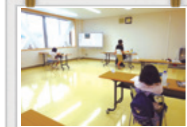
普段の学習の様子

各自学校の宿題や、お家で準備したテキストを持ってきて、自主学習をしています。 少人数で静かな空間のため、みんな集中して取り組めるようです