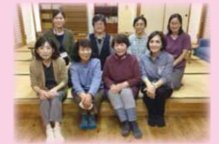
(撮影の為マスクをはずしています。)

私の地域でもこんな活動をしているよ！ こんな活動がしたいがどうしたら良いのか分からない… という地域の皆さん！ 下記のお問い合わせ先までご連絡をお待ちしております☆