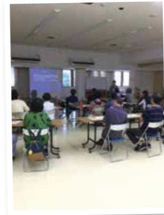
つぐみアカデミー

生活や趣味等で役に立つ勉強会をしています!つぐみアカデミーを終了してからも、出会った仲間たちと自分たちの住んでいる地域のために、楽しく清掃ウォーキング♪