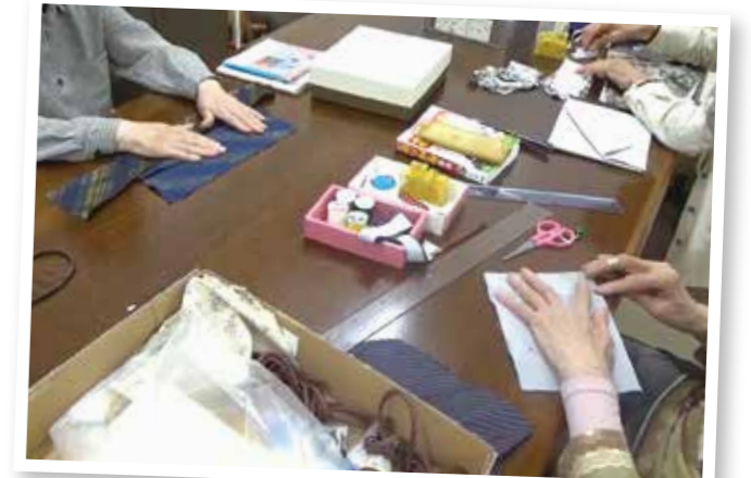
独居高齢者の集い 皆で余暇活動の時間に、楽しく物づくり中♪