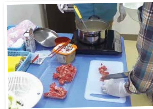
MORITO ROOM (モリトルーム) 自分たちで昼食を作って、料理のスキルUP!