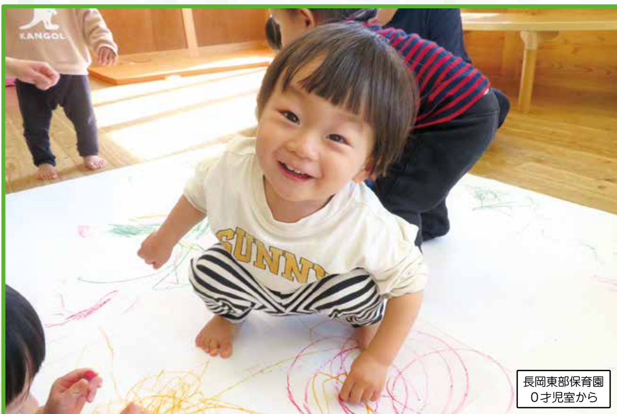
長岡東部保育園 0才児室から