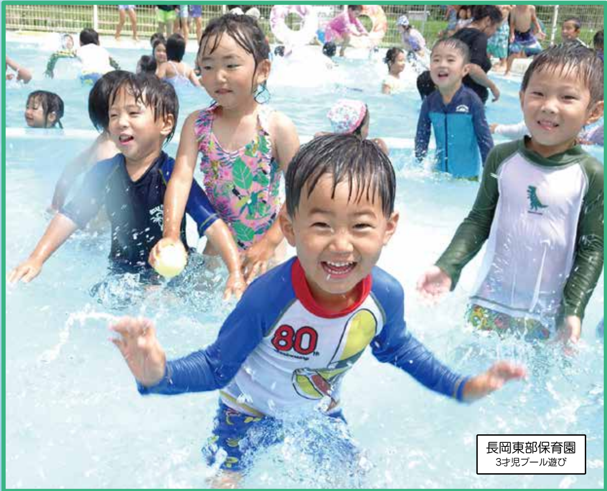
長岡東部保育園 3才児プール遊び