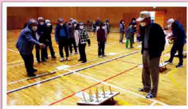
・南国市ろうれんピック2023 (三和スポーツ交流センター)