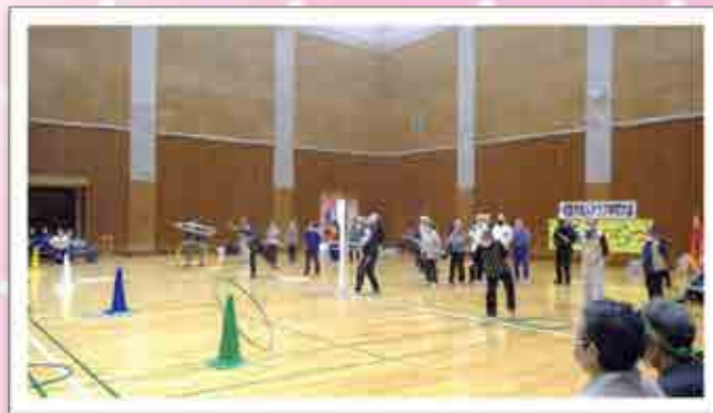
・令和5年度南国市老人体育大会 (南国市立スポーツセンター)