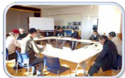
R5.12.4 前浜防災コミュニティセンターにて実施