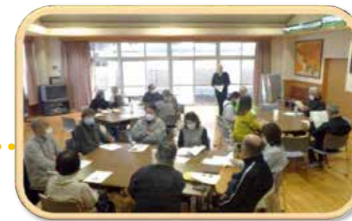
R5.11.28 稲生ふれあい館にて実施