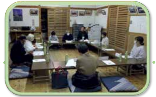
R5.12.8 緑ヶ丘県住集会所にて実施