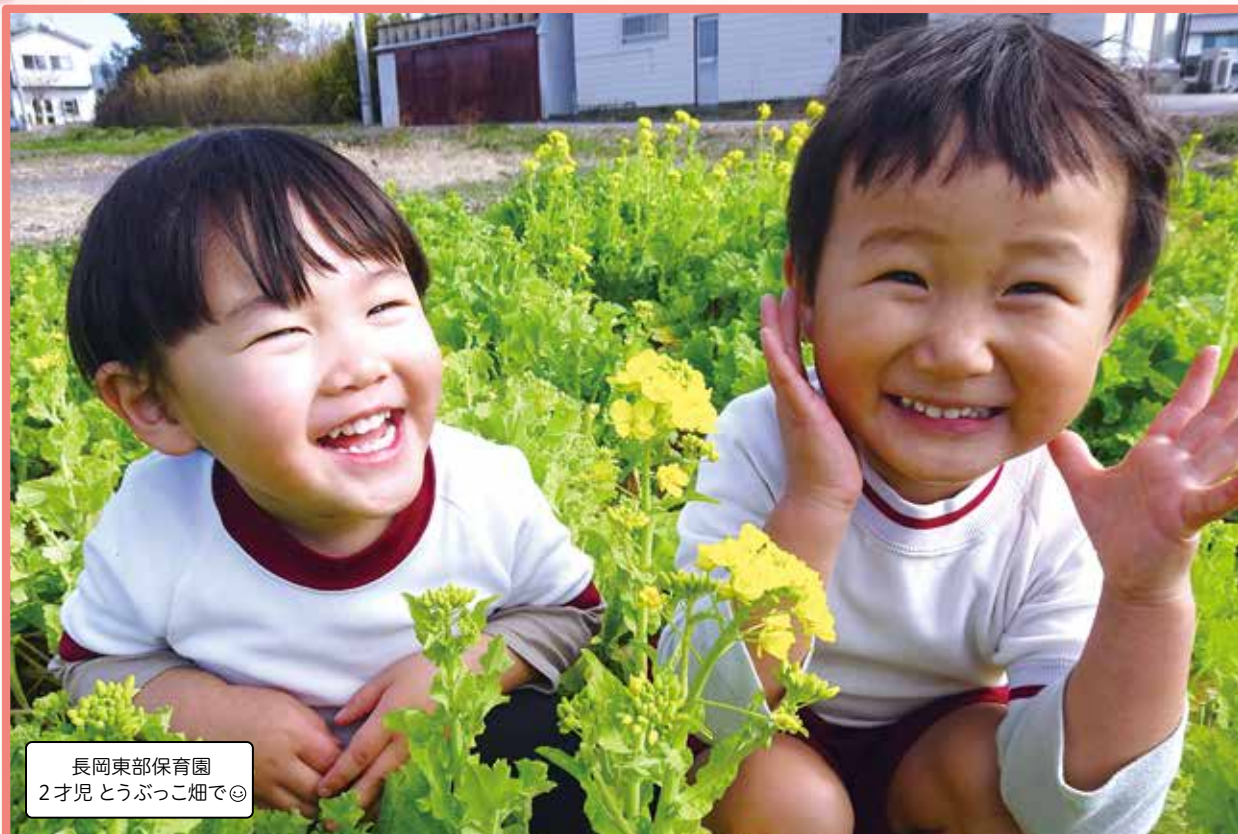
長岡東部保育園 2才児 とうぶっこ畑で◎