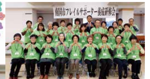
フレイルサポーター 2期生