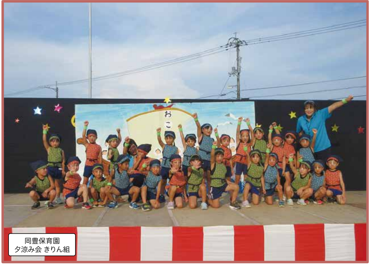
岡豊保育園 夕涼み会 きりん組