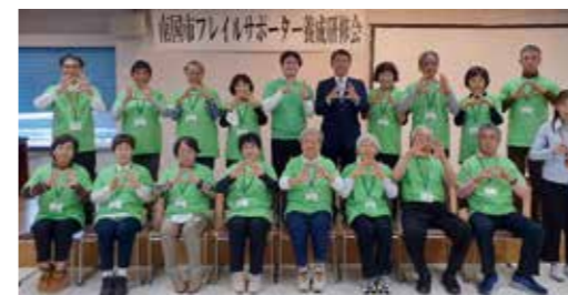
フレイルサポーター 1期生