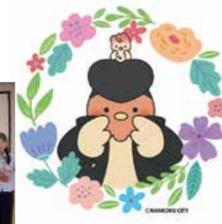
南国市フレイルサポーター養成研修会