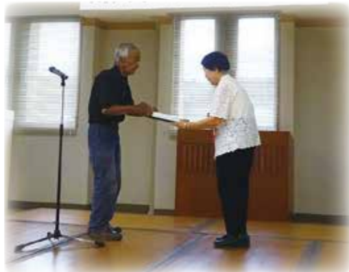
●大会長感謝 1名 ●大会長表彰 2名

令和6年7月4日(木)南国市社会福祉センターにおいて『令和6年度老人クラブ大会』が開催されました。式典では、長年にわたり、日ごろから老人クラブの活動に取り組み、活躍された方々に感謝の意を込めて顕彰しました。また、武内弁護士による『遺言と死後事務委任契約について』の講演や、音楽ボランティアの方の演奏など、充実した大会を皆様のおかげで無事に開催することができました。これからも南国市における老人クラブの発展にご協力くださいますようお願いいたします。