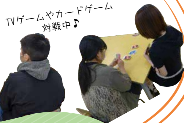
TVゲームやカードゲーム 対戦中♪