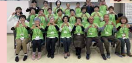
フレイルサポーター 3期生

現在南国市では40名を超えるフレイルサポーターさんが活躍中！ 我々と一緒にフレイル予防 活動を盛り上げて下さる仲間をまだまだ募集中です。 皆様からの声があれば、第4回フレイルサポーター養成研修の開催も検討していきます。