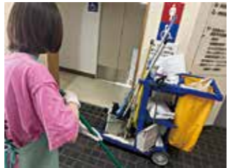
館内清掃で就労体験