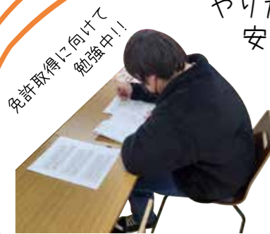
免許取得に向けて勉強中!!

一人ひとりに合わせたスケジュールでの参加が可能!! やりたいことに挑戦したり、ゆっくり過ごしたり、 安心して参加できる居場所になっています♪