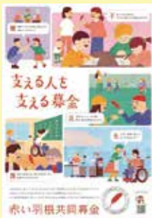
令和6年度赤い羽根共同募金ポスター(全国版)

本年も10月1日から全国一斉に赤い羽根共同募金の運動が始まっています。子どもからお年寄りまで一人ひとりが安心感と生きがいを持って暮らせる地域づくりの取り組みは、社会情勢、地域福祉課題が様々ある中、今後ますます重要になります。地域には、経済的な困難から衣食住が十分に確保できない人、居場所を失い孤立を深めている人、あるいはしゃべる相手もなく生活のハリをなくしている人さまさまざまな人々がさまざまなかたちで困っています。共同募金への寄附金は、その取り組みへの貴重な民間財源になります。共同募金運動は、各地区、職場、学校などで行われています。皆様のご支援、ご協力をどうぞよろしくお願いいたします。