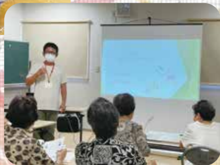
立田いきいき サークル での様子