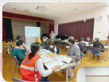
奈路地区での様子