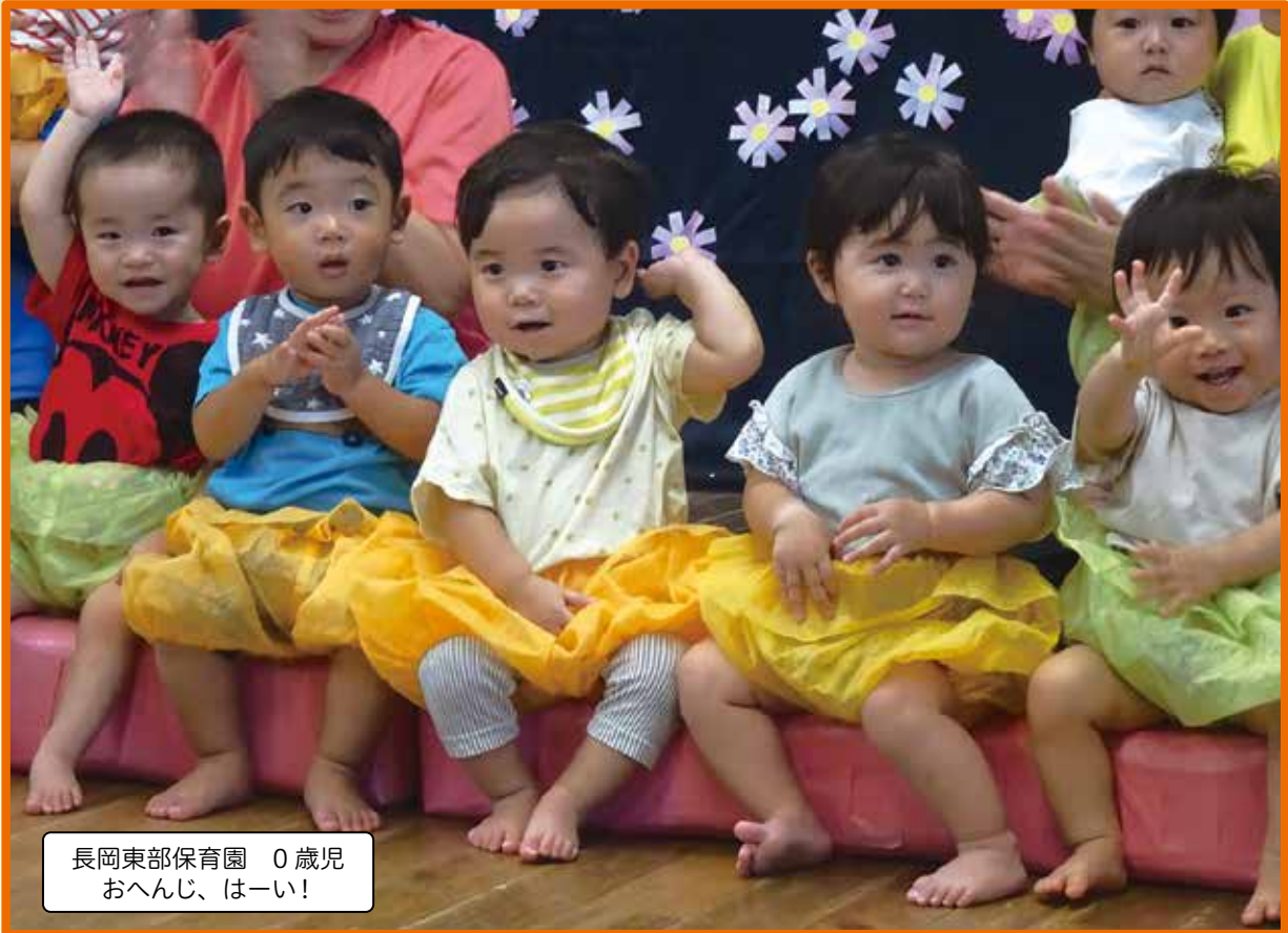
長岡東部保育園 0歳児 おへんじ、はーい!