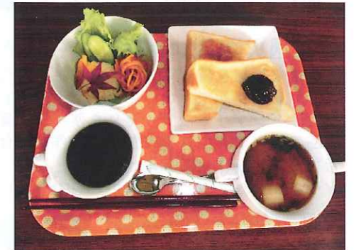
季節感あふれる本格的なモーニングがいただけます。