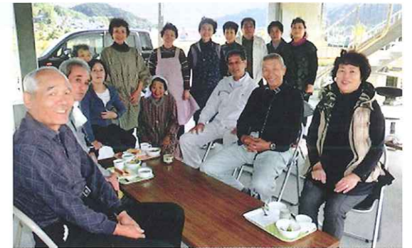
どなたでも大歓迎ですのでぜひ一度お立ち寄りください。