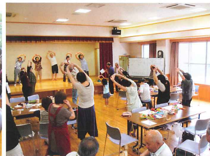
「北国の春」で健康体操!(^^)!

毎月、第2日曜日と第4水曜日の午前9時から午前11時まで、「ふれあい館」でサロンを開く予定です。参加費は100円。