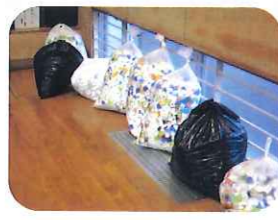
▲国府中学校のみなさまからのキャップの寄付