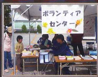
なんこくボランティアDAY