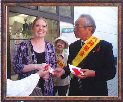
赤い羽根共同募金

メールアドレス nfukusi@nanshakyo.or.jp ホームページ http://nanshakyo.jp/