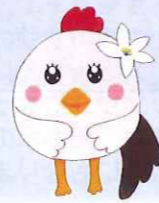
南国市社協キャラクター なっちゃん