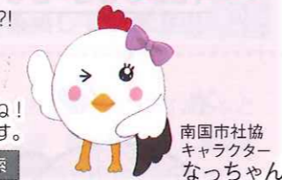
南国市社協 キャラクター なっちゃん